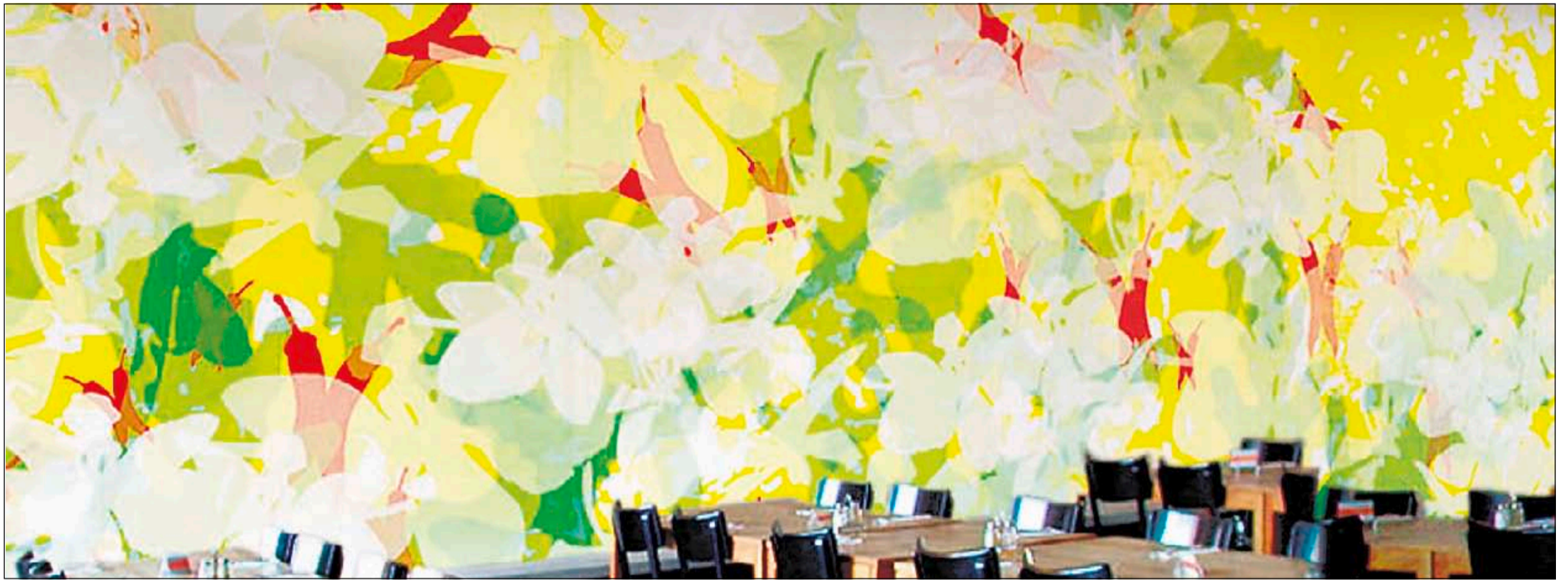
Rucola, Chilischoten und Blüten: Die Tapete «Dessert» von Sonja Schenk und Pia Thür siegte beim Wettbewerb «Raumgestaltung mit Tapete» und erfrischt seither die Brasserie Bernoulli in Zürich.

Oona Das Tropenhaus Frutigen bringt den ersten Schweizer Kaviar auf den Markt. Seite 15